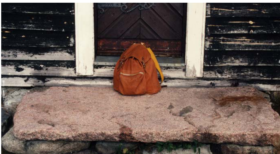
Håberget Nygarden Mattisstenen

21/7 11.00-16.00 Faldaasen skolemuseum, Åpen dag, aktiviteter og underholdning, bevertning.