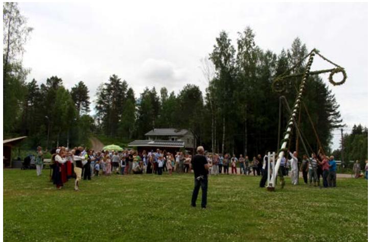
Foto från det årliga midsommarfirandet i Tyngsjö, Malungs Finnmark