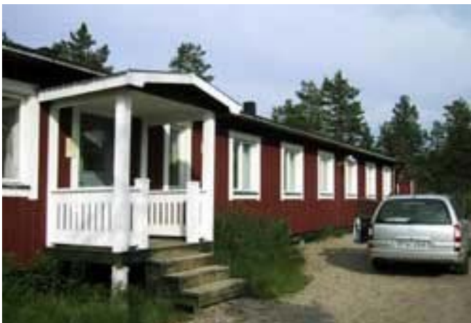
Vandrarhemmet vid långbergets Sporthotell