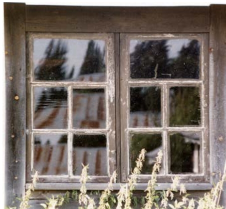
Håberget Nygarden insikt

17/8 Fellestur med overnatting på Åsnes og Grue Finnskog, Dulpeterpet – Smågårdssetra – Rotberget, 7 + 15 km, påmeldingsfrist 3/8