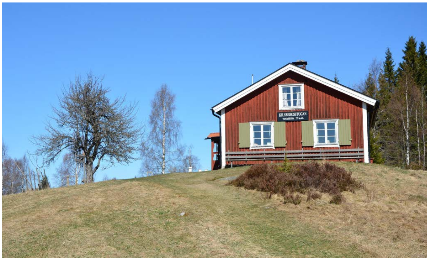
Vid foten av finnbosättningen Tomasboda

Skriften är framtagen med stöd från Kilsbergsfrämjandet, Kungliga Patriotiska Sällskapet, Letterstedtska föreningen, Länsstyrelsen i Örebro län, Region Örebro län, Örebro kommun samt Örebro läns hembygdsförbund.