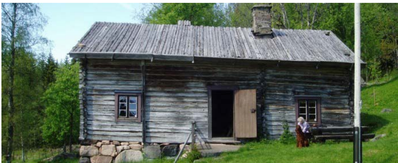
Finngården Kallstan, Rikkenberget

Överkurs: Besök Pilgrimstapeten, med filmvisning och fika vid Utmarksmuséet. Dalby Hembygdsgård