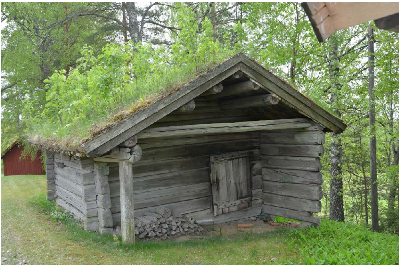
Linbastu i finnbyn Tryggeboda, Kvistbro socken.

Du är välkommen att vara med på boksläpp av boken Finnarna i Kilsbergen söndag 9 juni! Skriften är avsedd att närmare beskriva områdets finska kolonisationshistoria med avseende på orsaker, kultur, innehåll och utbredning.