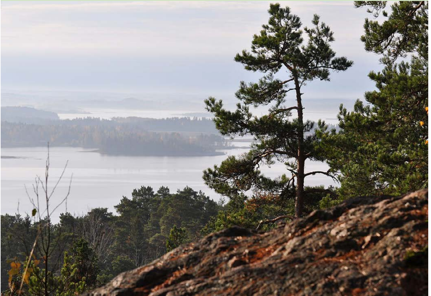
Utsikt mot Bråviken från Kolmården

Under en lördag och söndag i slutet av oktober samlas intresserade deltagare till ett helgseminarium i Kolmården. Då samlingen äger rum i Östergötland blir det första gången som FINNSAM anordnar någon aktivitet i detta landskap.